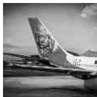
Kam Air(アフガニスタンカム航空会社)に中村哲さんの肖像画

なぜ日本人、それも平和の使者が撃たれたのかを私たちは海外に出かけて真実を知る必要があるでしょう。日本は 2011 年以降アフリカのジブチに自衛隊基地を置いて武装しています。かつては