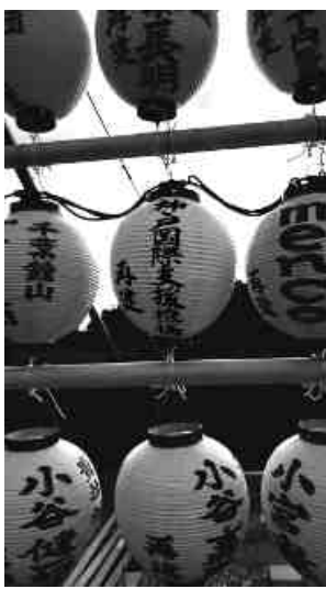
復興の提灯

「災害支援金」はわずかですから、ボランティアは心の復興、寄り添うはたらくに軸足をおくこととなります。機構は宮城県石巻市渡波で、2014年に、市議員から「あなたたちはいつまでボランティアで神戸から来るのか」といふかしがられたことがあります。その際、「心の傷が癒えていない方がおられなくなるまで来させていただきます」と機構の代表者は応答されました。つまり心の復興は、3年とか、5年と数字で計るようなわけにはいかないのです。合掌。