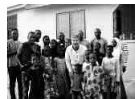
現地の報道「ワ」2020年1月4日付