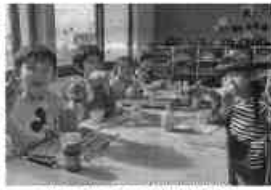
園児たちが育てた新米に触れて喜ぶ様子。